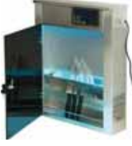
BSU 110 UV IŞINLI ÇOKLU BIÇAK STERİL ÜNİTELERİ