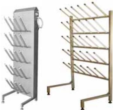
CIT 110 H