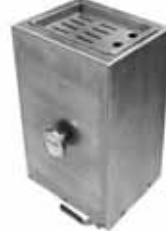
BSS 510 SU HAZNELİ ÇOKLU BIÇAK STERİL ÜNİTELERİ