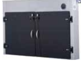
BSU 120 UV IŞINLI ÇOKLU BIÇAK STERİL ÜNİTELERİ